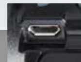
(Micro-USB-Eingang Typ B)