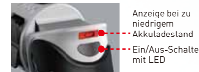
Anzeige bei zu niedrigem Akkuladestand Ein/Aus-Schalter mit LED