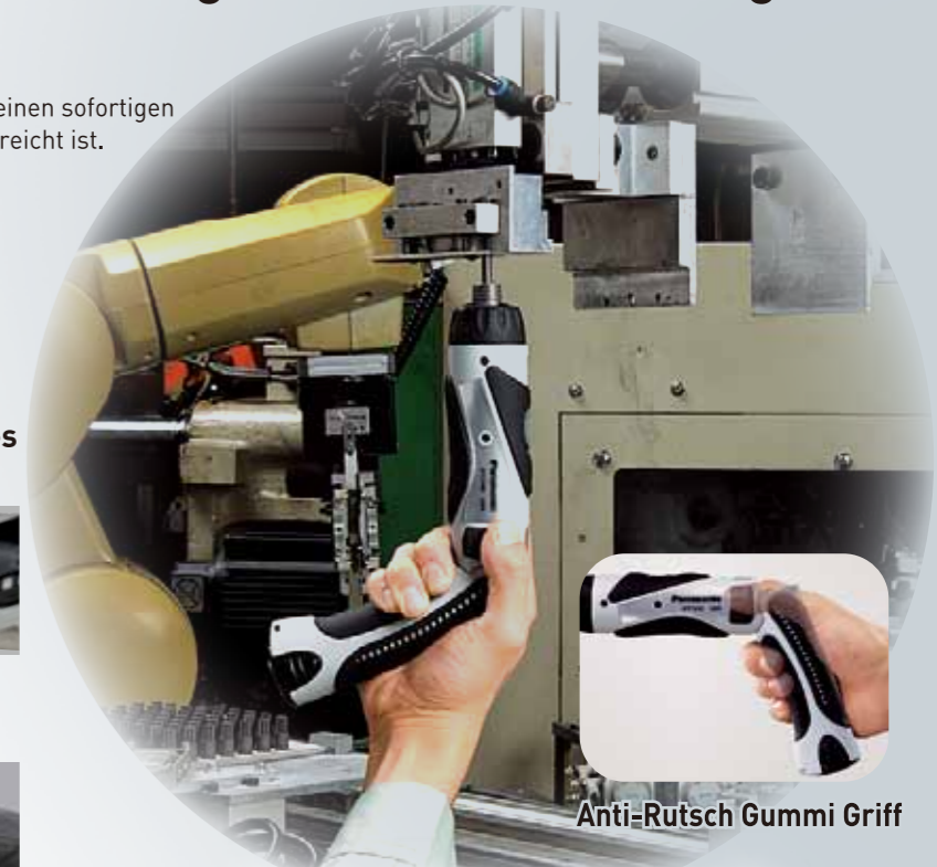
Anti-Rutsch Gummi Griff