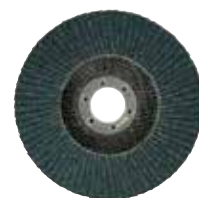
Fächerschleifscheiben Körnung 40/60/80/120 Ø 115 mm und Ø 125 mm