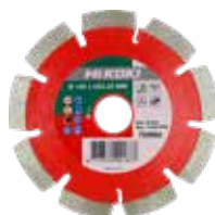
Premium Diamant Trennscheibe Abrasiv Ø 115 mm 752861 Ø 125 mm 752862