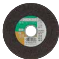
Trennscheibe INOX Ø 115 mm 782301 Ø 125 mm 782302