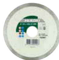
Premium Diamant Trennscheibe Fliesen Ø 110 mm 752886 Ø 125 mm 752887