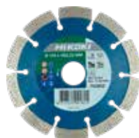
Premium Diamant Trennscheibe Stein Ø 115 mm 752851 Ø 125 mm 752852