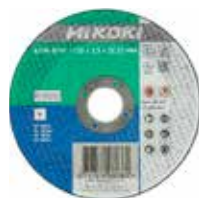
Trennscheibe Metall Ø 115 mm 4100201 Ø 125 mm 4100202