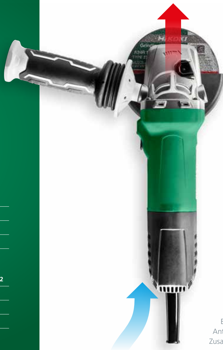
Beispiel: Mit Antivibrations- Zusatzhandgriff