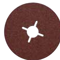
Fiberschleifblätter Körnung 24/36/60/80/120 Ø 115 mm und Ø 125 mm