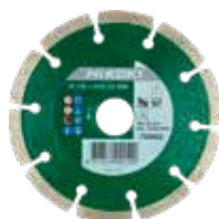
Diamant Trennscheibe Universal Ø 115 mm 752801 Ø 125 mm 752802

Für den ultimativen Staubschutz können Sie jederzeit den optionalen Staubfilter anbringen. Es verhindert, dass (Metall-)Staub in das Elektrowerkzeug gelangt, sodass Sie sicher sein können, dass sich in Ihrem Winkelschleifer keine Stäube befinden.